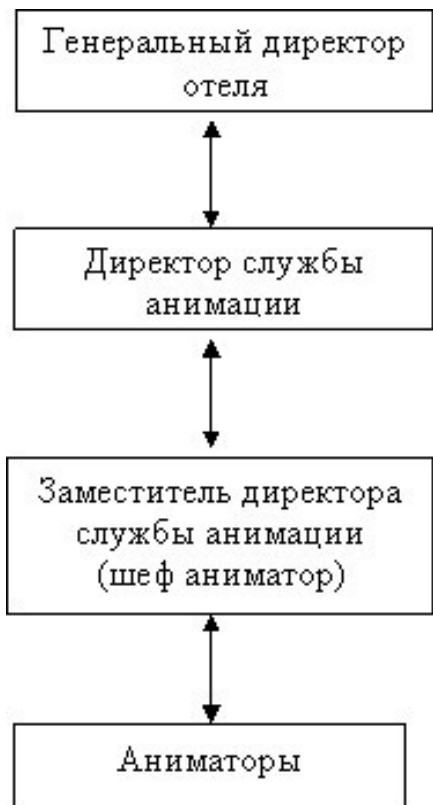
Рисунок 2 – Структура менеджмента анимации