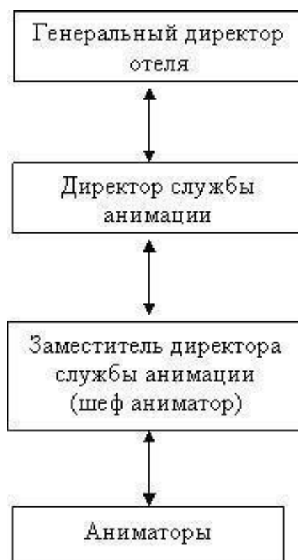
Рисунок 2. Структура менеджмента анимации