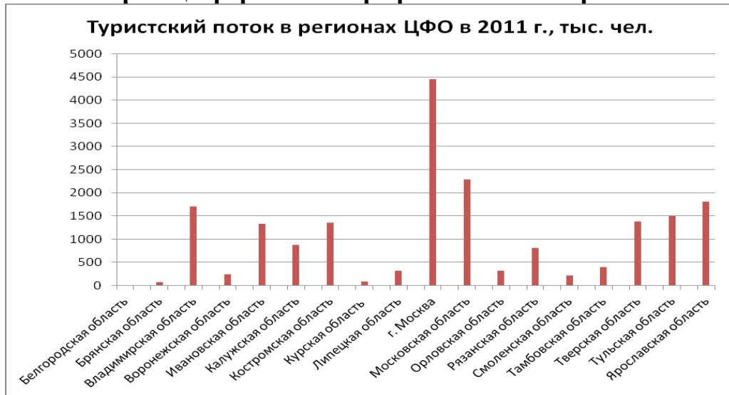
Рисунок 1 – Распределение туристского потока по областям Центрального федерального округа