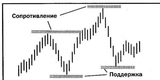
Рисунок 1.1 –Уровни поддержки и сопротивления

Рисунки должны иметь сквозную нумерацию в пределах главы арабскими цифрами. При этом номер рисунка состоит из номера главы и порядкового номера рисунка, разделенных точкой. Рисунки обязательно должны иметь наименования. Номер рисунка отделяется от его наименования с помощью тире. Номер и наименование помещаются после рисунка и центрируются. Точка в конце наименования рисунка не ставится. Например: